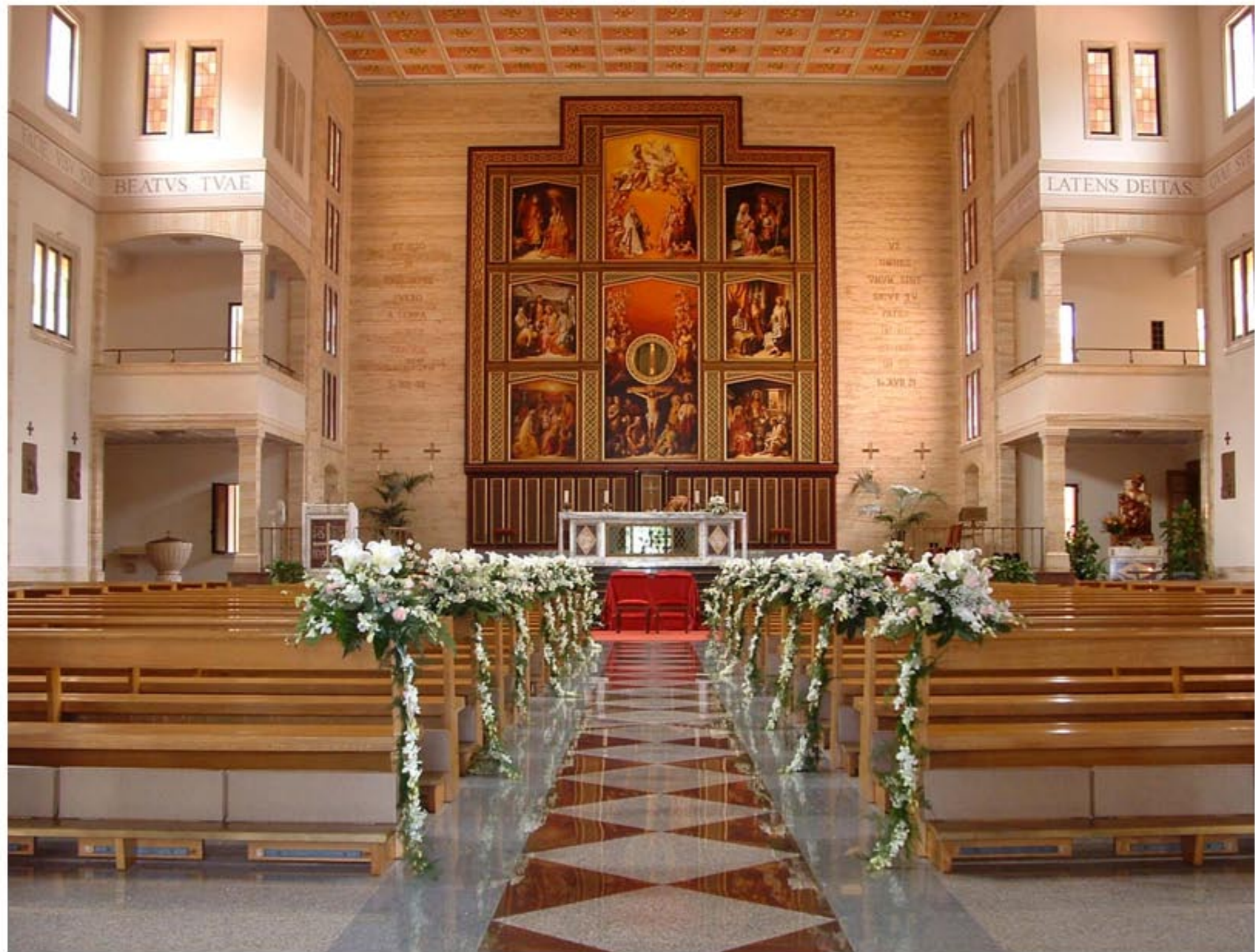
Rose rosate e fiori bianchi per renderlo delicato