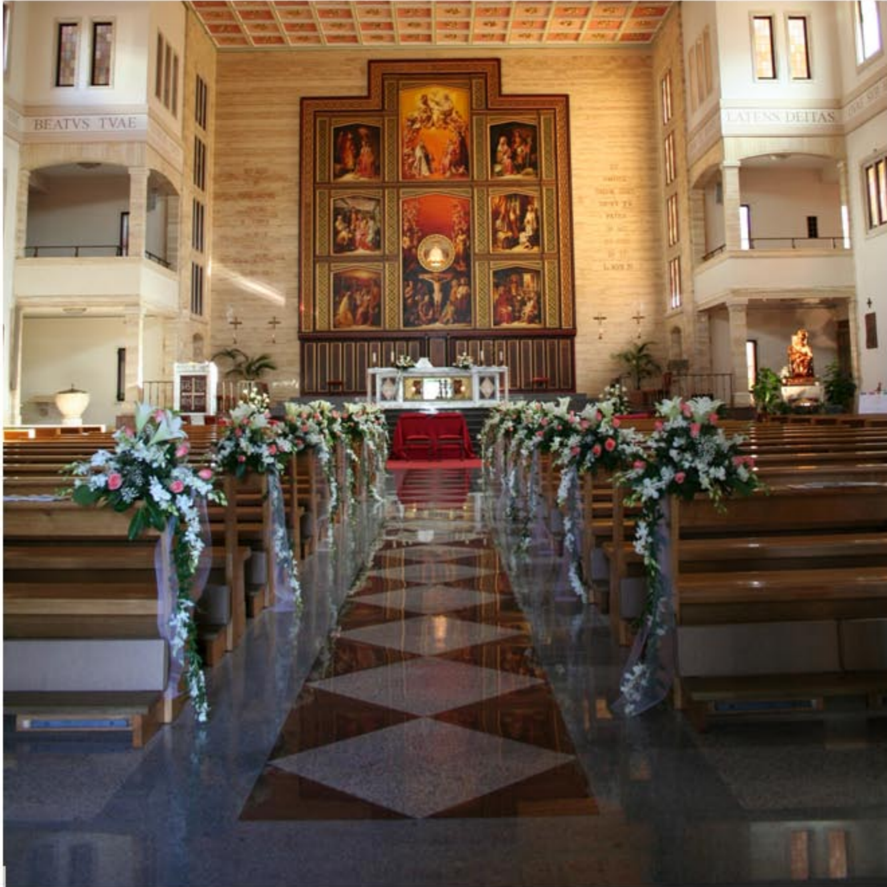
Cascata di tull con Orchidee, Lilium e Rose rosa