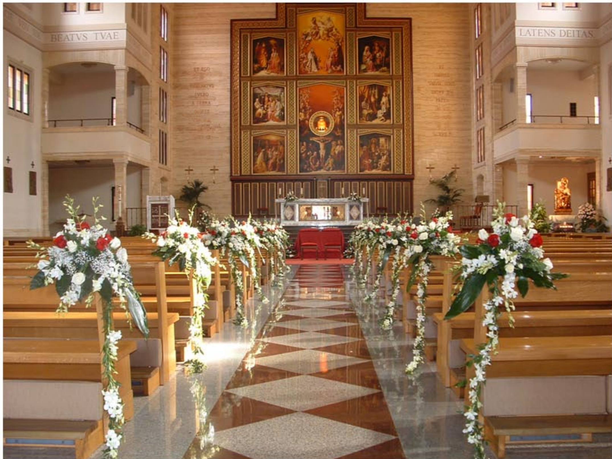
Fiori bianchi e rossi per dare un gioco di luce