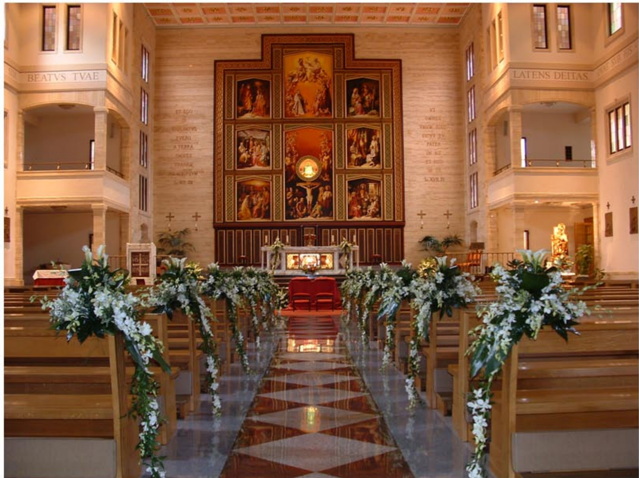
Forma a cascata con Callette e Orchidee