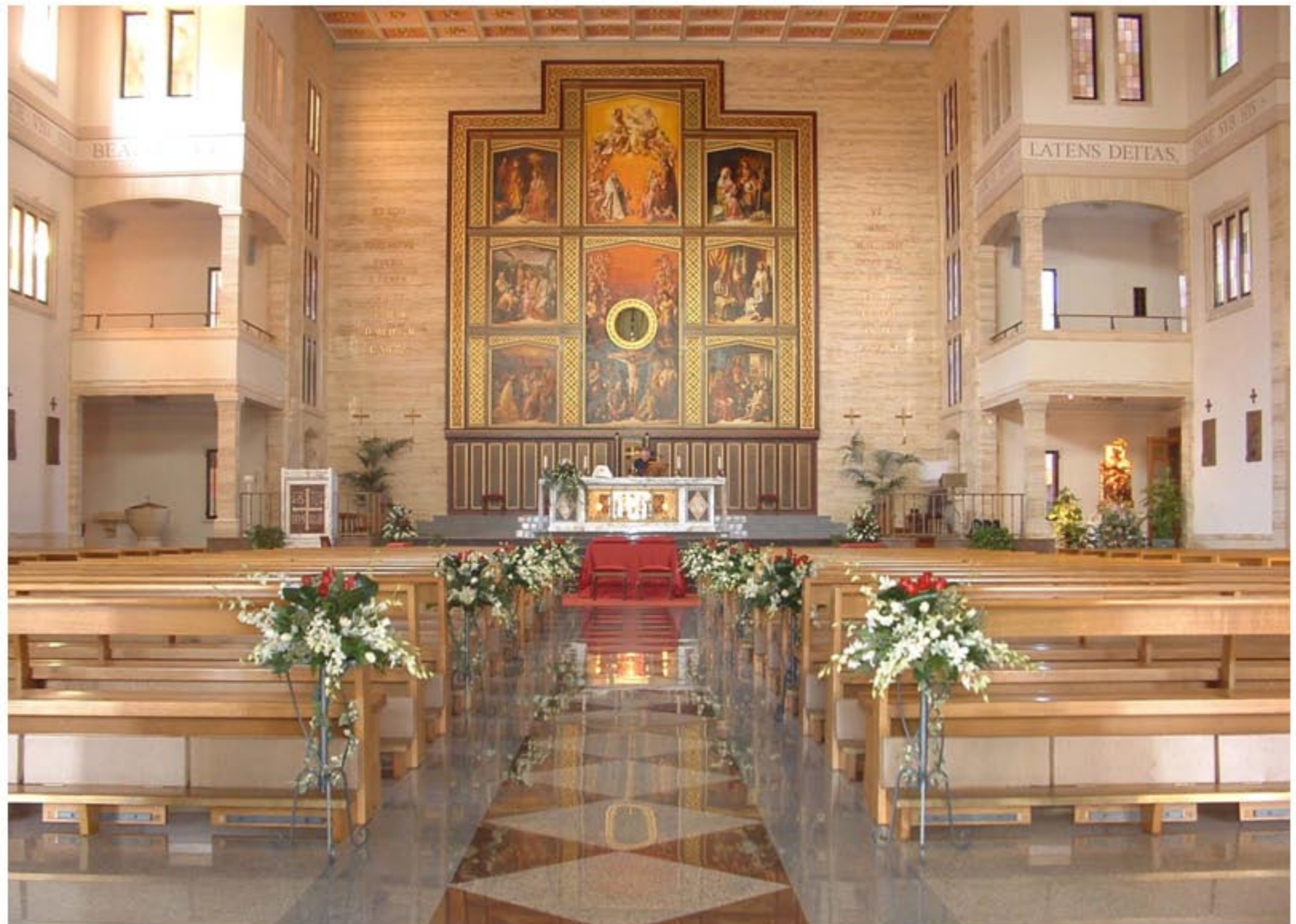
Struttura sul ferro battuto con Rose rosse